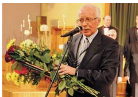
Godina Latvijas patriotus ⇒ 4. lpp.