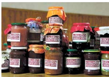
Ziedo labdarībai ⇒ 2., 3. lpp.