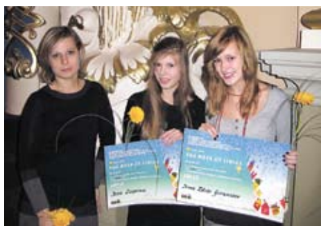
Par talantu – Lidices roze ⇒ 4. lpp.