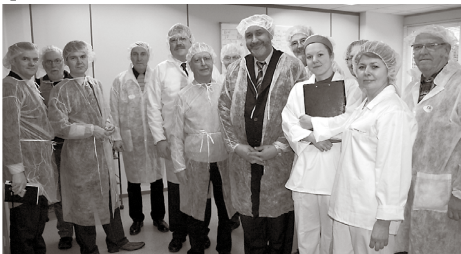
Konditorijas izstrādājumu ražotnē Baltās naktis Baložos.

Bordesholmas viesu uzņemšanā brīvprātīgi iesaistījās ne tikai Ķekavas - Bordeshol-