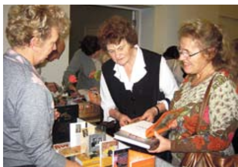
Ieskats Grāmatu svētkos ⇒ 12. lpp.